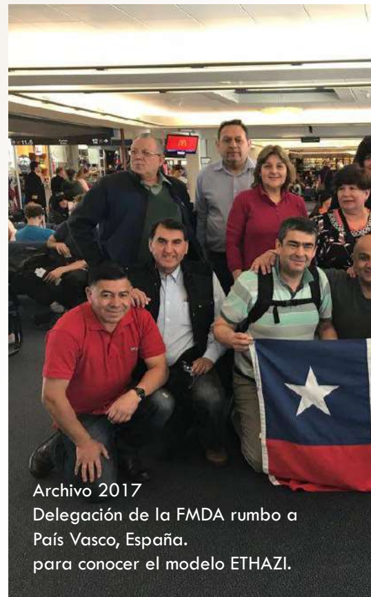
Archivo 2017 Delegación de la FMDA rumbo a País Vasco, España. para conocer el modelo ETHAZI.

La vinculación con esta reconocida y destacada institución europea ubicada en el País Vasco, tiene como propósito fortalecer nuestra gestión educativa y pedagógica de la formación técnica profesional que imparten los establecimientos de enseñanza media de nuestra Fundación a través de la implantación de nuevas metodologías de enseñanza de aprendizaje colaborativo basado en retos (ETHAZI) para lo cual se han desarrollado diferentes estrategias como formación de mentores con pasantía en el centro, webinar y apoyo directo con acompañamiento a los establecimien-