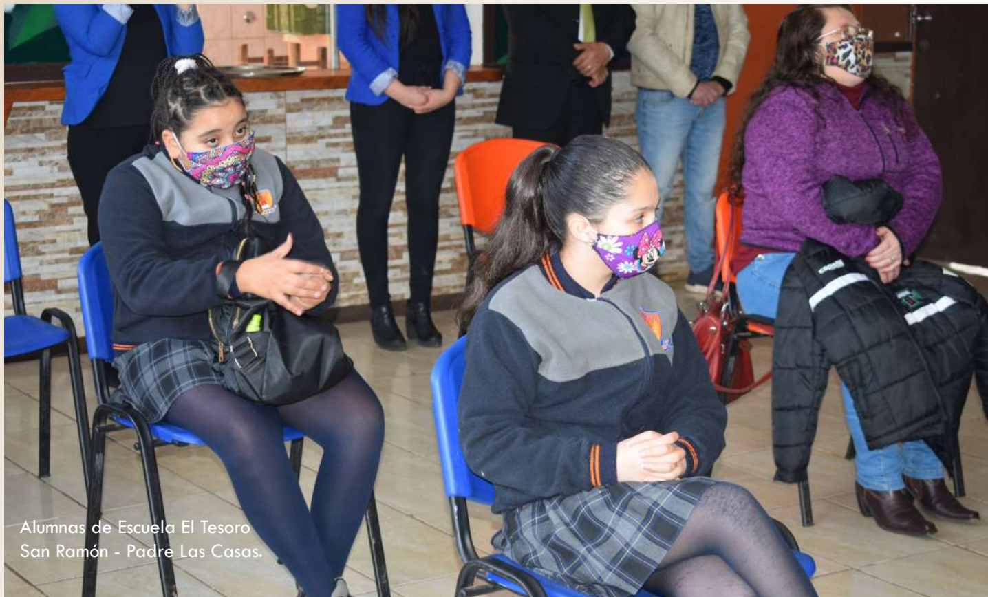
Alumnas de Escuela El Tesoro San Ramón - Padre Las Casas.