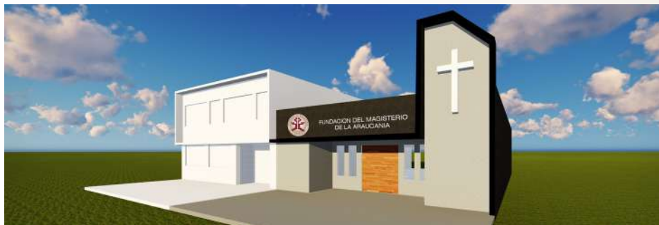
Fundación del Magisterio de La Araucanía

El Departamento de Saneamiento Ambiental y Mantenimiento, está encargado de la Planificación, Coordinación y Ejecución de todas las acciones conducentes a la concreción de los Objetivos propuestos en el ámbito de la Infraestructura, para llegar finalmente a la obtención de los Certificados que avalan tener y mantener cada uno de nuestros Establecimientos Educativos en forma Saneada según la reglamentación legal vigente, y así de esta forma lograr ejecutar el proceso enseñanza aprendizaje en nuestros alumnos de la forma más adecuada posible, lo cuál es nuestro fin último.