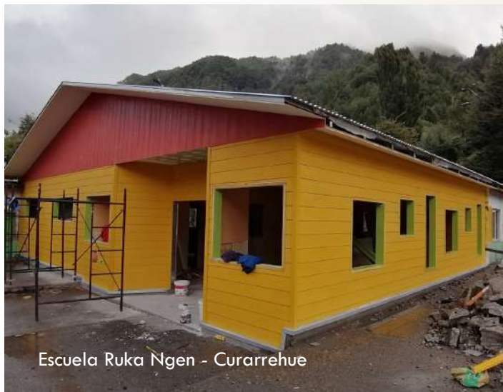
Escuela Ruka Ngen - Curarrehue