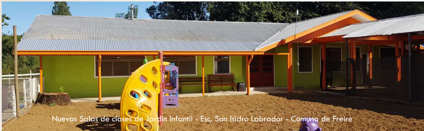
Nuevas Salas de clases de Jardín Infantil - Esc. San Isidro Labrador - Comuna de Freire