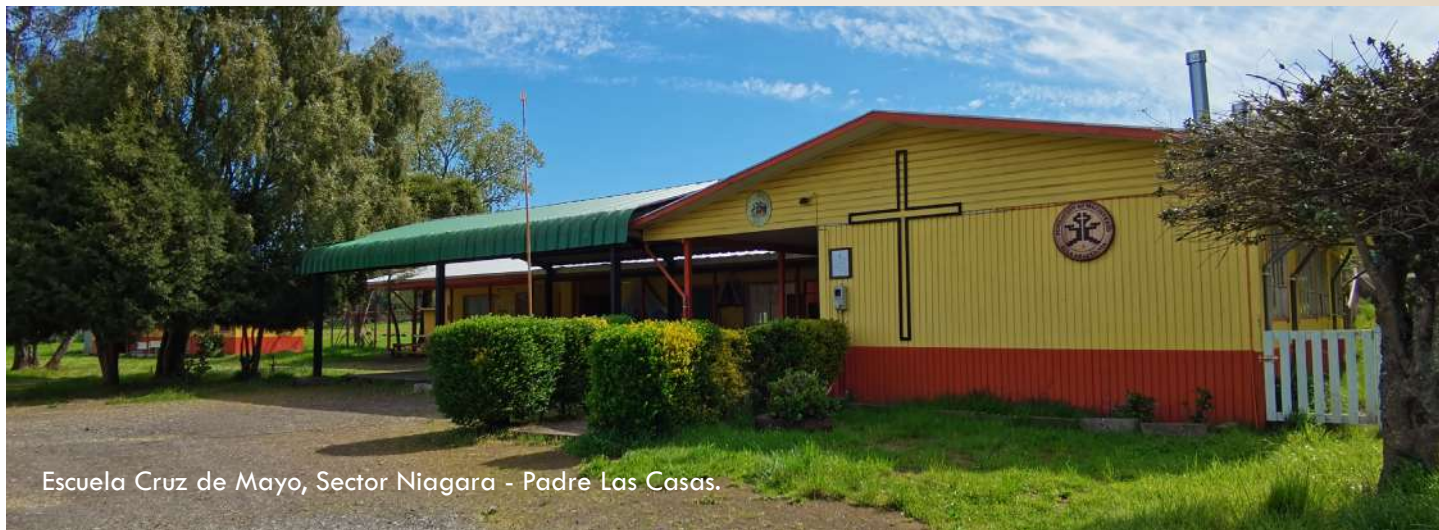
Escuela Cruz de Mayo, Sector Niagara - Padre Las Casas.

fiscalizaciones de diferentes aspectos que traspasaron la primera instancia llegando en algunos casos a los procesos administrativos, no obstante, logramos a través de argumentos y medios de prueba evitar las sanciones de multa, por lo tanto, señalar, que en este trabajo colaborativo de siempre con los directores ha sido eficaz.