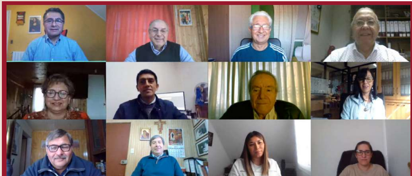
Reunión de Coordinadores de Departamentos Administración Central.