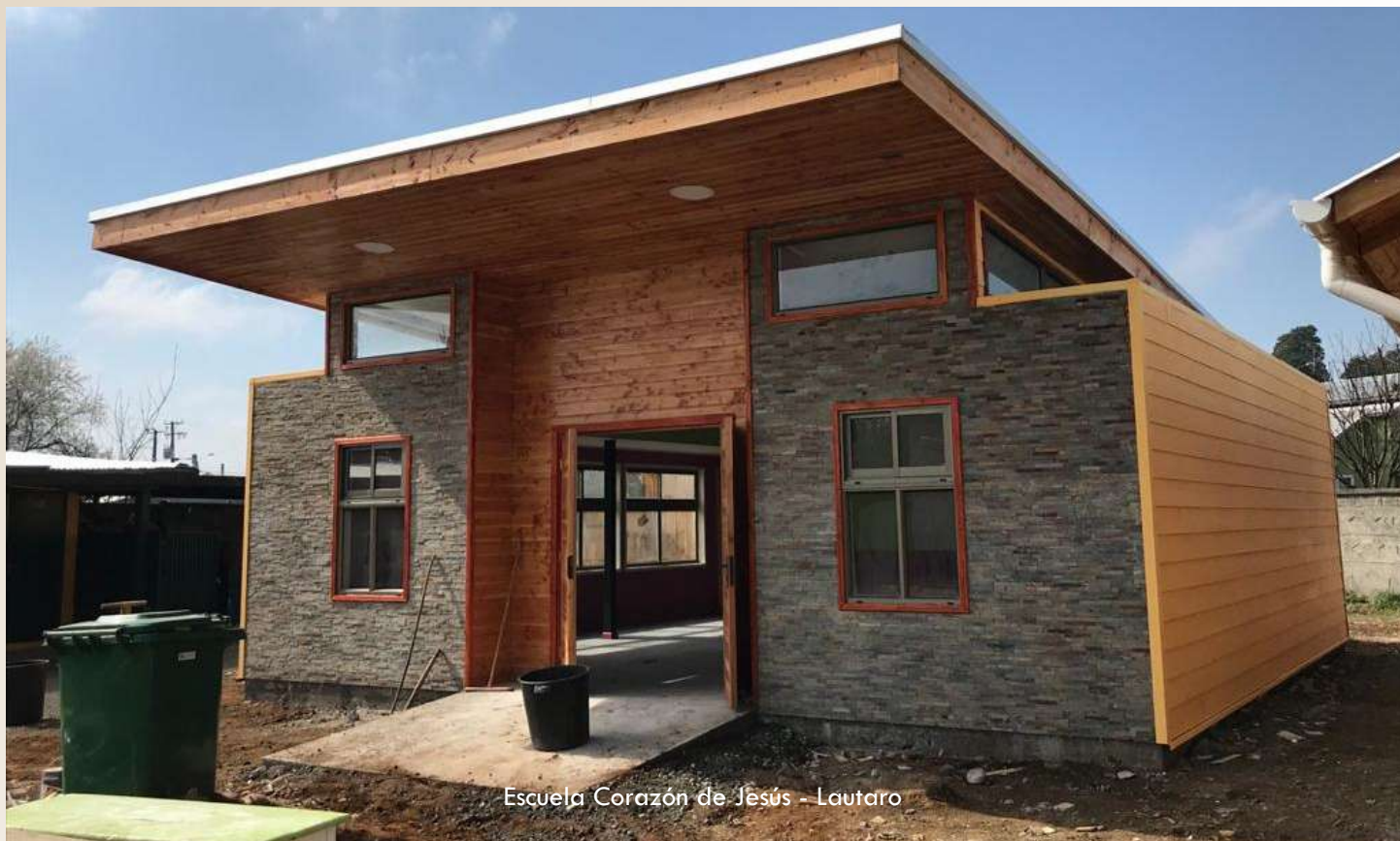
Escuela Corazón de Jesús - Lautaro