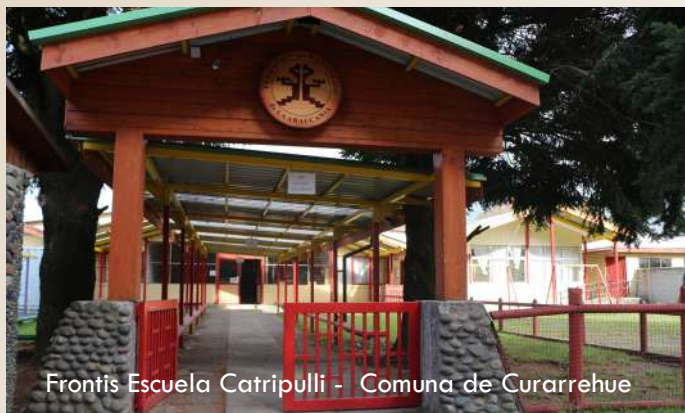
Frontis Escuela Catripulli - Comuna de Curarrehue