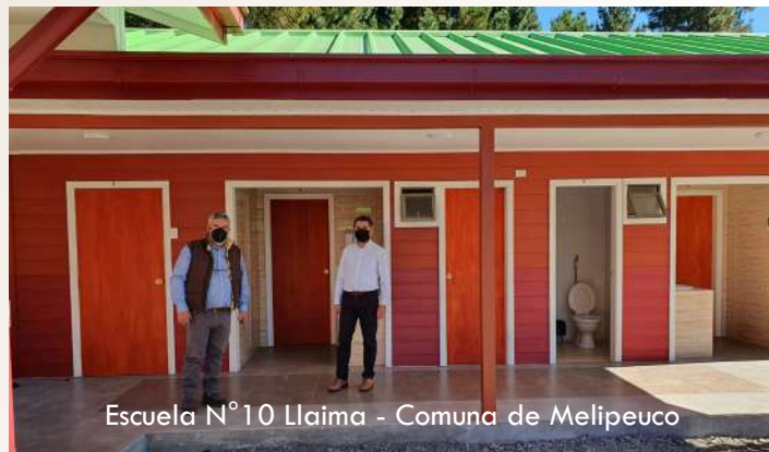
Escuela N°10 Llaima - Comuna de Melipeuco